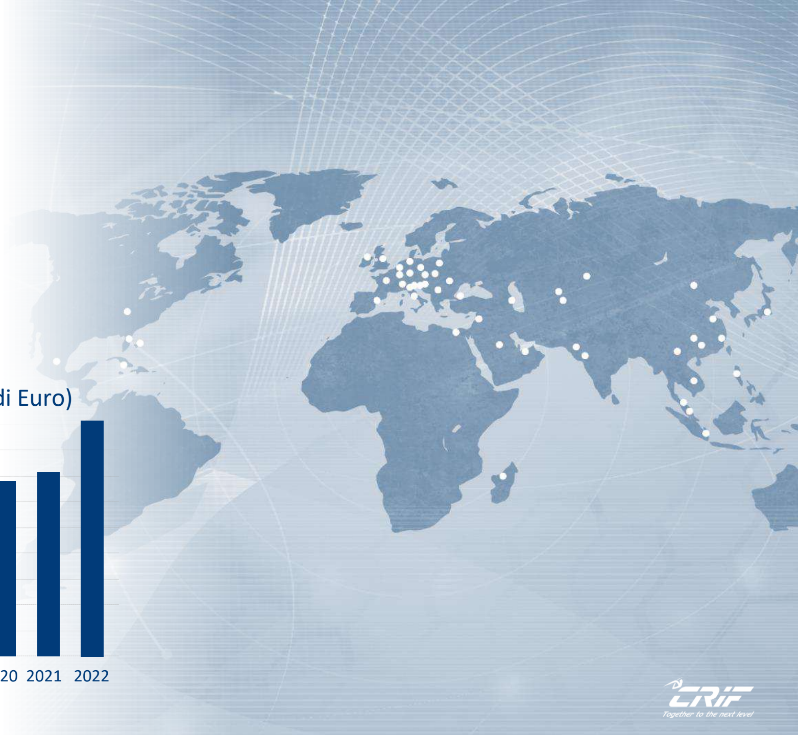
VALORE DELLA PRODUZIONE (milioni di Euro)